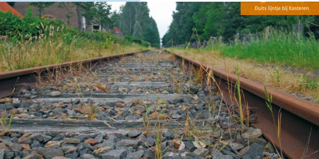
Duits lijntje bij Kasteren

De Noord Brabantsch-Duitse Spoorweg Maatschappij (NBDSM) van Boxtel naar Goch en Wesel werd in 1873 aangelegd. Dit 'Duits lijntje' was populair bij bedevaartgangers naar Kevelaar. U ziet in Kasteren het voormalige station dat in 1894 gebouwd werd. Tegenwoordig is het een woonhuis. In 1937 kwam er een eind aan het personenvervoer en in 1984 werd ook het goederenvervoer gestaakt.